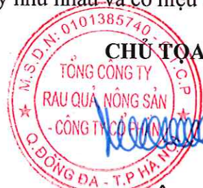
MAI XUÂN SƠN